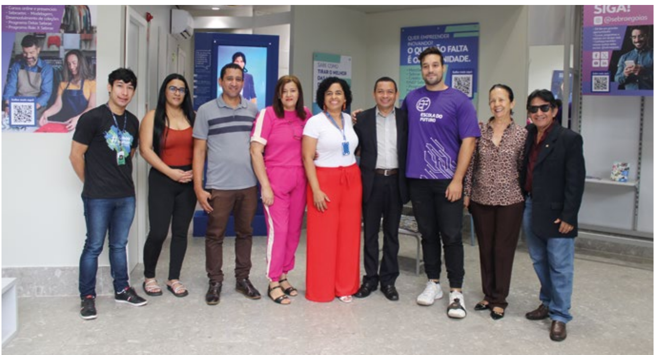
Time do Sebrae e parceiros em visita ao espaço

Horário: segunda a sábado das 10h às 22h; domingos: das 14h às 20h