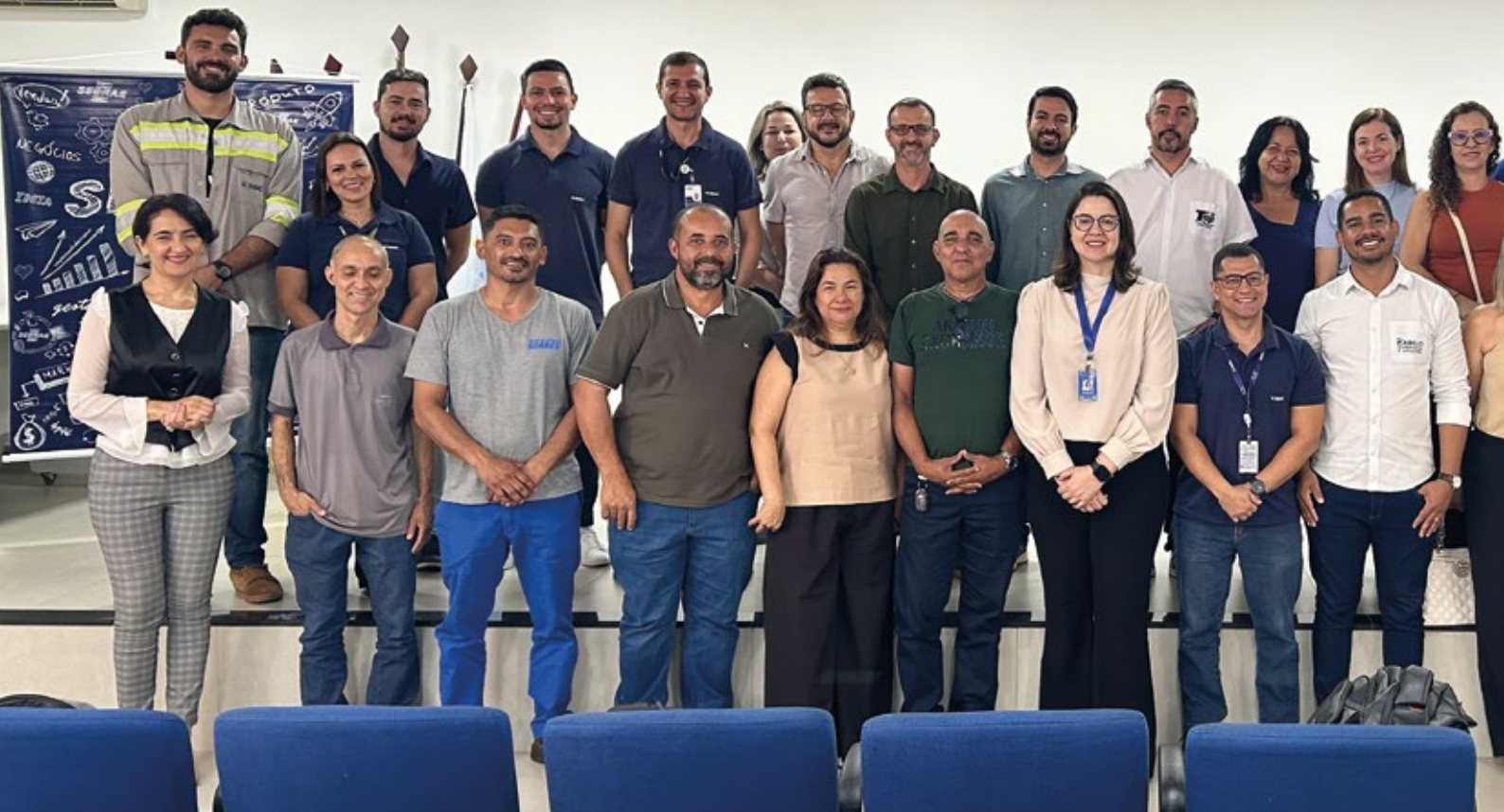
Sebrae, CMOC e empresários participantes do Programa Fornecedor Capacitado