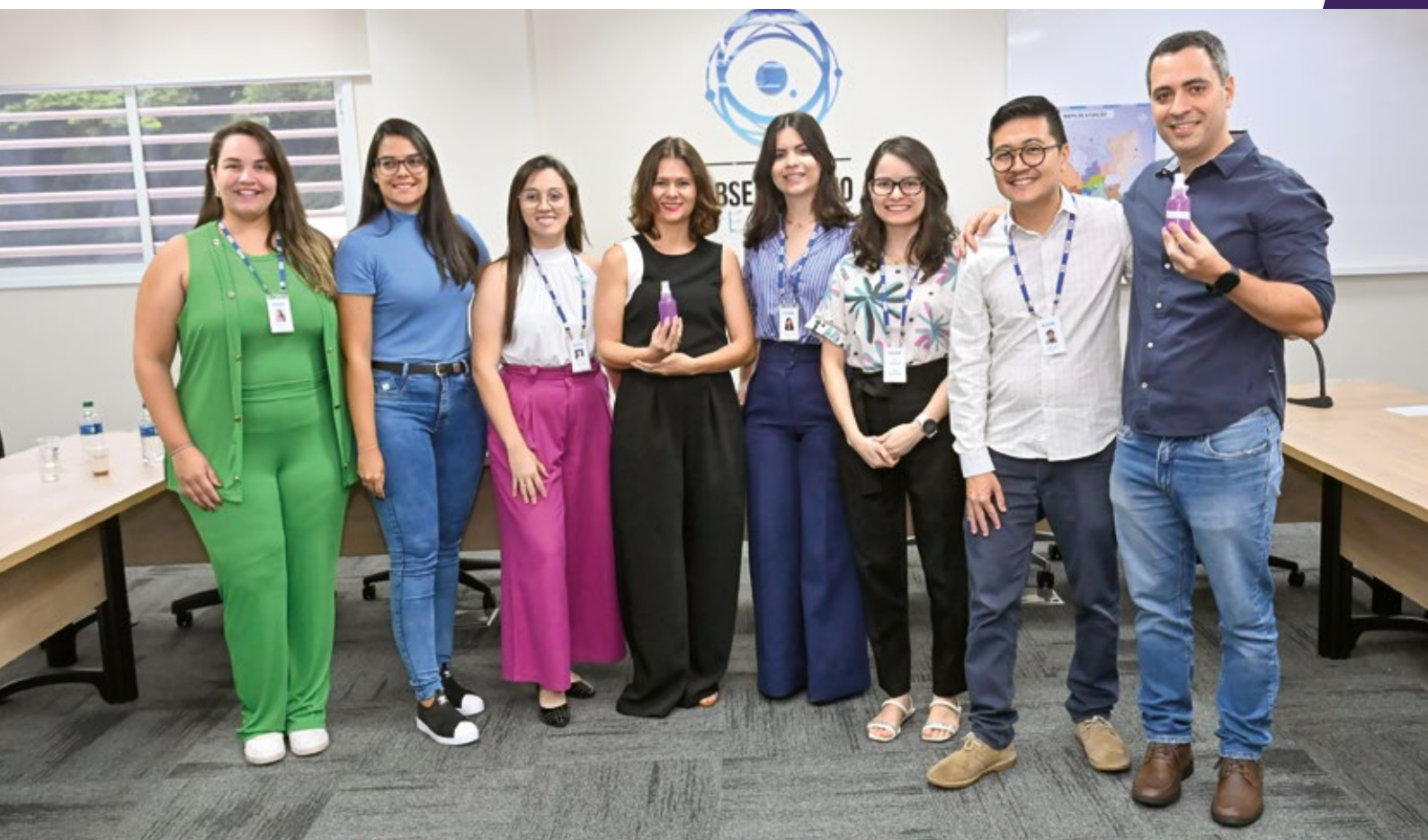
A Mazza 2000 mostrou seu projeto de “Desenvolvimento de nanoemulsão a partir do óleo de jojoba para cutículas”

O futuro de Goiás é promissor. Com um olhar atento para as tendências do mercado e um compromisso com a inovação, o Sebrae Goiás e o Senai Goiás estão com investimentos no desenvolvimento de um ecossistema de inovação robusto e sustentável. Através do Edital Regional de Inovação, empresas goianas têm acesso a um ambiente propício para a criação e desenvolvimento de novos negócios. Os objetivos são claros: posicionar o estado como um dos principais polos de inovação do Brasil, fortalecer a economia e construir um futuro mais próspero.