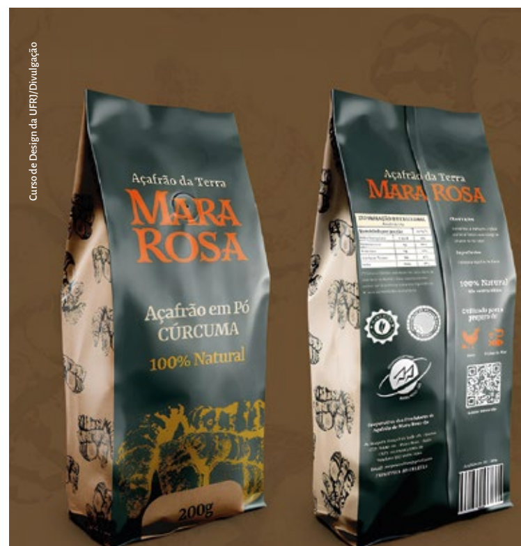
Identidade criada pelos alunos do curso de design da UFRJ para o Açafrão de Mara Rosa