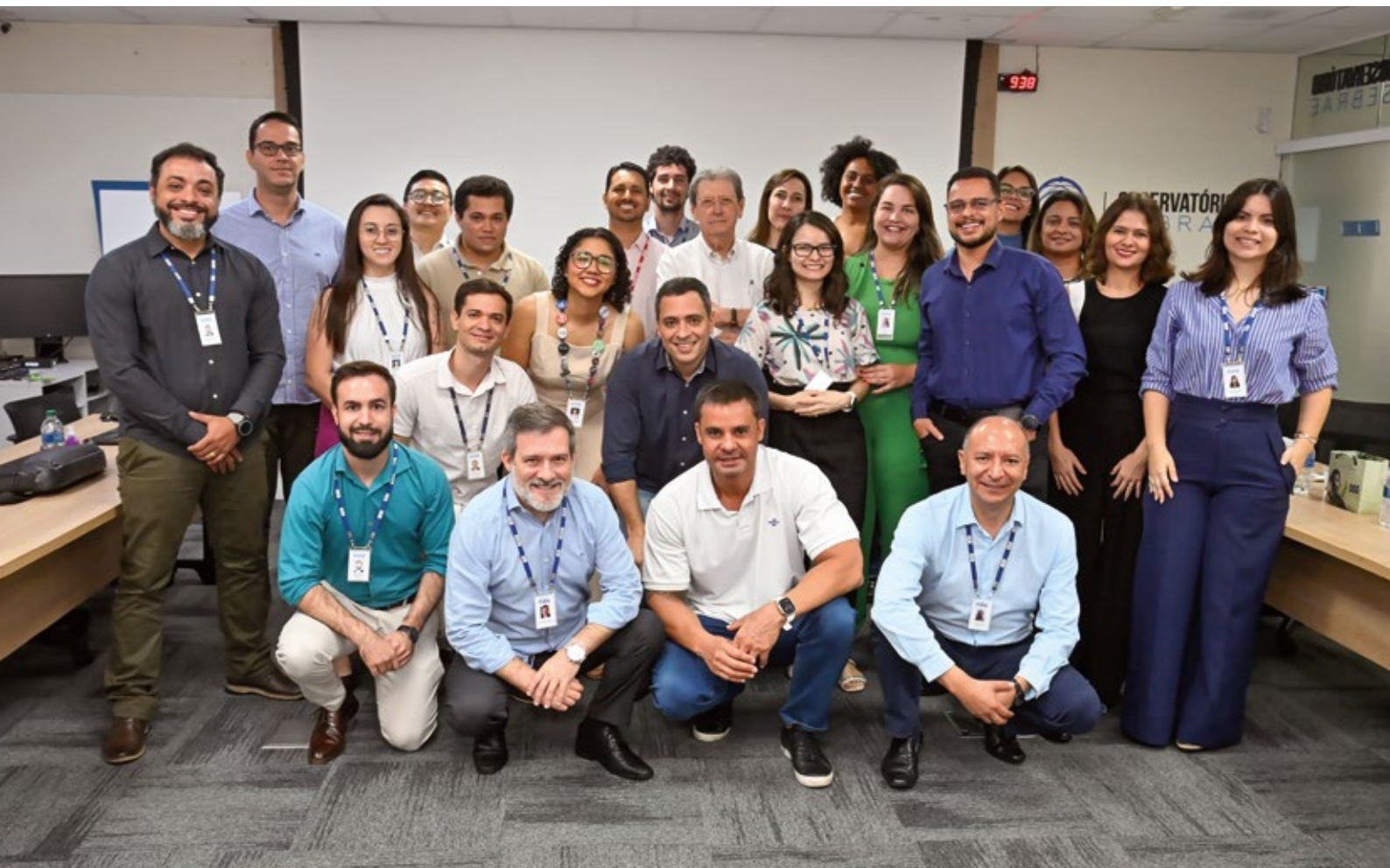
União de empreendedores, Sebrae Goiás e Senai Goiás é um marco na indústria do estado