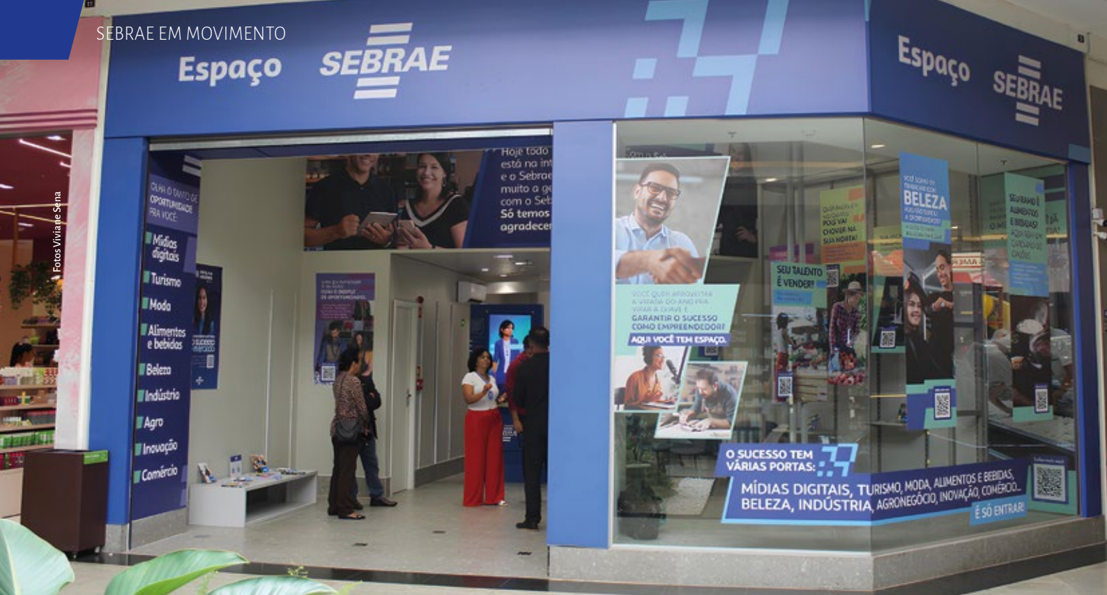
A loja do Sebrae Goiás no Shopping Sul, em Valparaíso de Goiás, funciona com autoatendimento