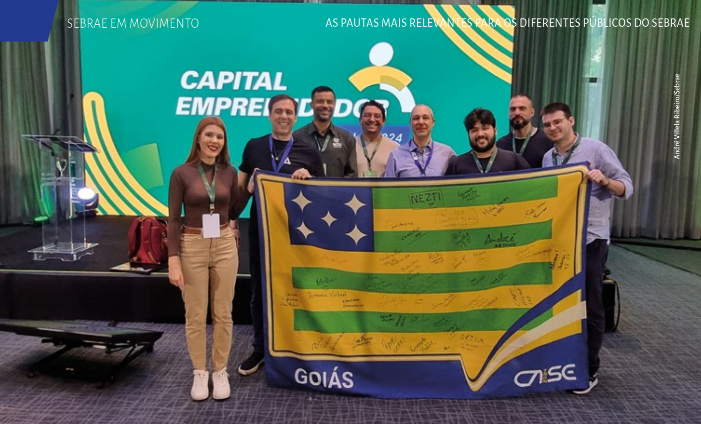
Seis startups de Goiás foram finalistas nacionais em São Paulo