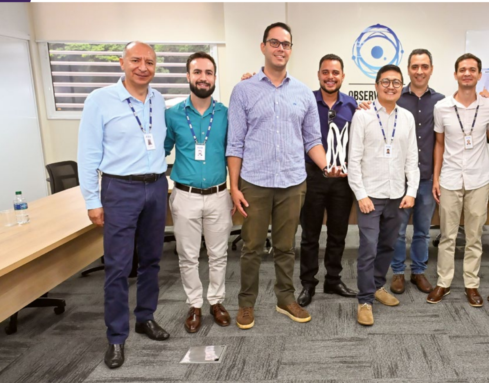
O projeto "Torno PCNC", da Croc Bom, também foi contemplado e apresentado ao Sebrae Goiás e Senai Goiás

com o removedor de cutículas de acetona. "Esse ciclo propiciou ainda ampliar os horizontes, ter mais pessoas no corpo técnico e alcançar uma tecnologia que antes a gente nem imaginava que poderia ser viável", analisa.