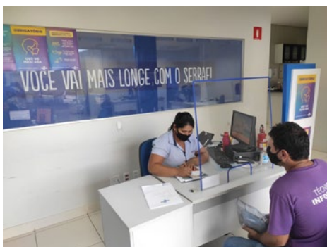
Atendimento Presencial – Regional Sudoeste, 20 a 23/12/2021 Unidades: Rio Verde e Jataí.