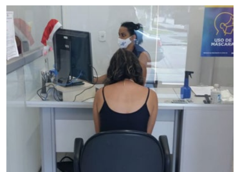
Atendimento presencial ao MEI, 28 e 29/12/2021, AG São Luís de Montes Belos.