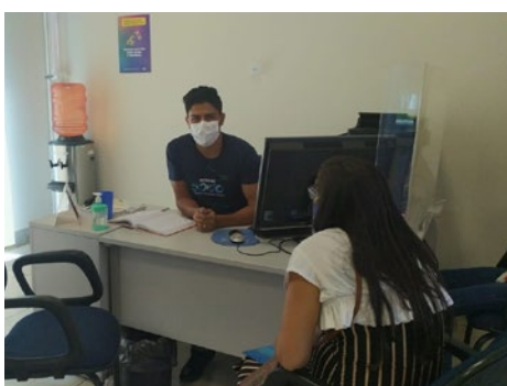
Atendimento presencial ao empresário de Porangatu com informações sobre o Microempreendedor Individual, 27/12/2021, agência Porangatu.