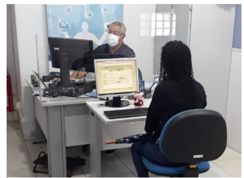
Atendimento, agência Posse.