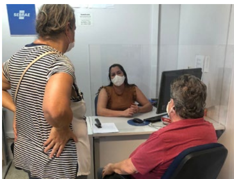
Atendimento presencial ao empresário de Caldas Novas com informações sobre o Microempreendedor Individual, 27/12/2021, agência Caldas novas.