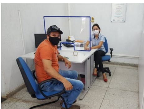
Clientes tirando dúvidas sobre como se tornar um micro empreendedor individual, 27/12/2021, agência GOIANÉSIA.