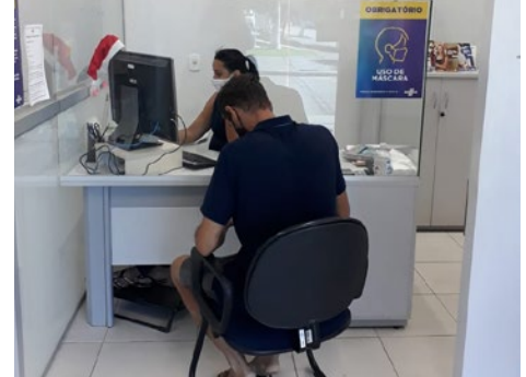
Atendimento presencial ao MEI, 27/12/2021, AG São Luís de Montes Belos.

O atendimento virtual do Sebrae Goiás permanece à disposição dos clientes, tanto pelo 0800 570 0800 quanto pelo portal: sebraego.com.br/vitrine .