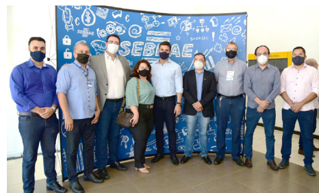
Autoridades de Jataí com Secretário e Diretor

Santa Rita do Araguaia, Santo Antônio da Barra, São Simão, Serranópolis.