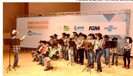
Durante os Encontros não faltaram atividades artísticas